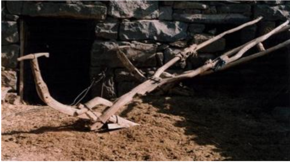
الشكل (1) المحراث الخشبي

ومع أن بلدة طمرة خسرت معظم أراضيها بعد عام 1948 خاصة بعد أن سلخت السلطة الإسرائيلية أكثر الأراضي الزراعية والخصبة في السهل الغربي من البلدة وتركت لأهلها حوالي 12000 دونماً في المناطق العالية وسفوح المرتفعات ومع ذلك تضاعف نشاط السكان واخذوا يبنون المصاطب في المنحدرات ويستغلونها في البناء وزراعة الأشجار المثمرة من زيتون وتين وعنب وتفتح إلى جانب زراعة الخضار بأنواعها.