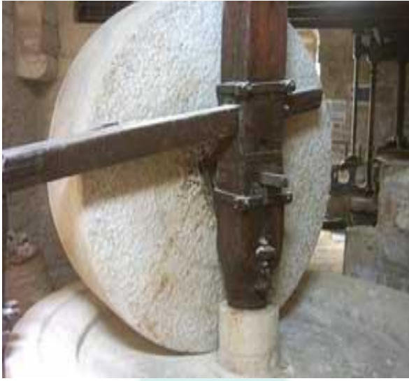
دولاب عصر زيتون

باتت تستهلك دخل الأسرة وقد شاعت صناعات تحويلية في المدينة مثل الصناعات الغذائية (معلبات رب البندورة والطحينة والألبان) والكونسروة والخضار والفواكه من بقول (عدس حمص فول بازلاء وذره وغيرها) وتلعب ميزة التبريد دوراً هاماً في هذا المجال إلى جانب آلات الخياطة والتريكو والمعامل الحديثة التي تشغل مئات العمال وخدمات المدن وما يتطلب من أيدي عاملة في المؤسسات والدوائر الرسمية والخاصة مثل المدارس والنوادي والجمعيات والمقاهي وغيرها.